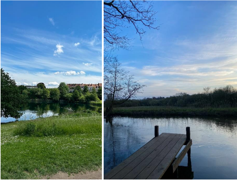
links: Kreidebergsee, rechts: Wilschenbruch

Wie wäre es mit einem Spaziergang im Grünen?